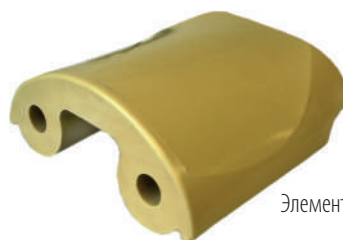
Элемент для садки